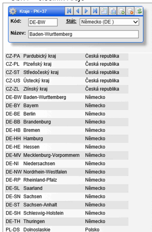
Obr.1 – číselník Kraje